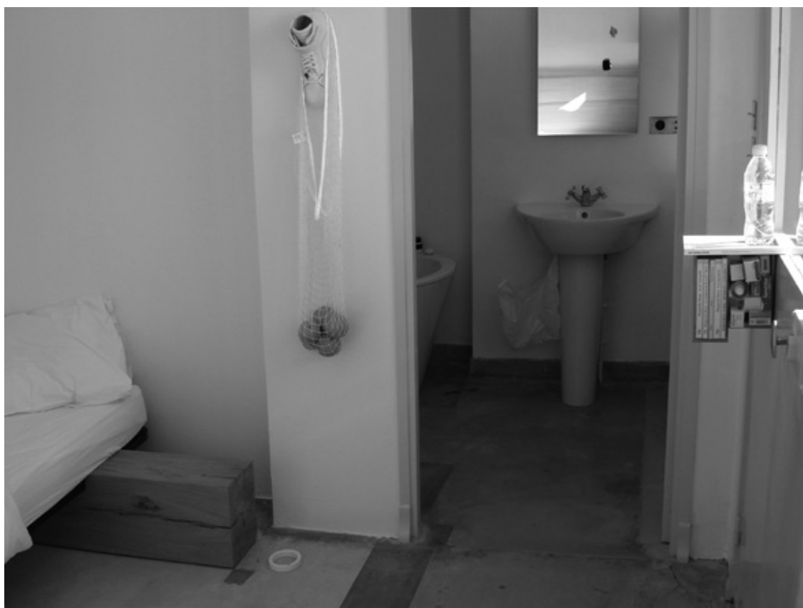
Chambre de résidence / Villa Noailles, 2007, aménagement permanent, design David Dubois